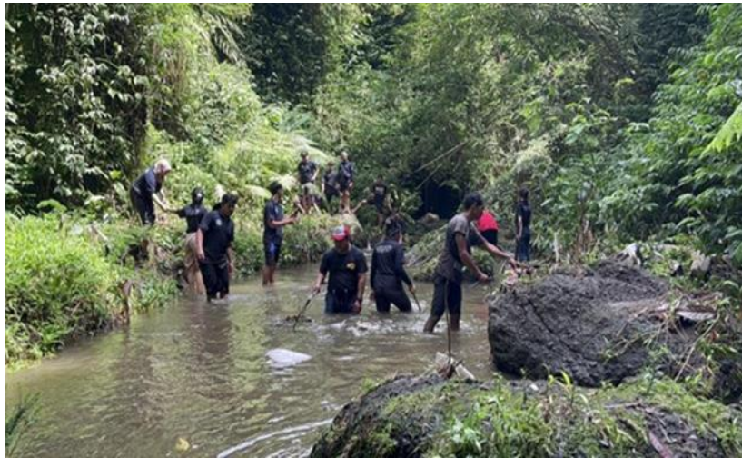
Gambar 4. Gotong Royong di Area Pesiraman Tirtha Gunung Merta