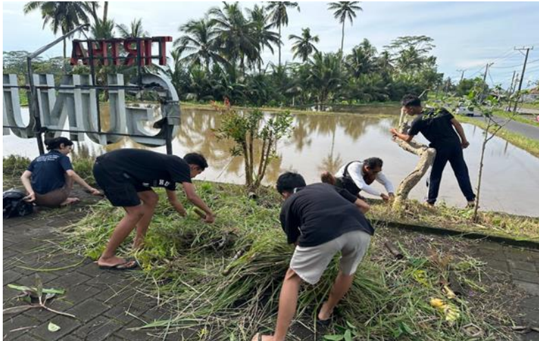
Gambar 3. Gotong Royong di Area Pura Gunung Merta

(Fika, et al., 2023). Dengan melibatkan sekeha teruna teruni , diharapkan mereka dapat memahami pentingnya menjaga kebersihan lingkungan, dapat membangun karakter peduli lingkungan, mengembangkan rasa tanggung jawab terhadap lingkungan serta dapat membangun kebersamaan dan solidaritas. Selain itu, (Noverita et al., 2022) pengenalan betapa pentingnya kebersihan di lingkungan sekitar harus terus dilakukan guna menumbuhkan rasa cinta mereka terhadap lingkungan serta mengetahui betapa pentingnya lingkungan sekitar bagi kehidupan. Berkat kerjasama dan semangat kebersamaan, kegiatan gotong royong dapat terlaksana sesuai harapan. Lingkungan sekitar pura menjadi bersih, terlihat lebih tertata dan rapi.