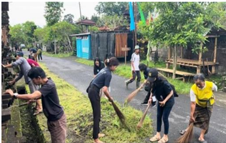
Gambar 2. Gotong Royong di Banjar Benawah

Jalur utama menuju lokasi Air Terjun Toya Selaka banyak ditumbuhi rumput yang cukup tinggi dan kurang tertata. Setelah berkoordinasi dengan pengurus desa, pada tanggal 19 Januari 2025 dilaksanakan kegiatan gotong royong untuk membersihkan area menuju Air Terjun Toya Selaka dan di lingkungan Pura Dalem Mpu Aji yang berada di depan pintu masuk menuju air terjun. Gotong royong melibatkan masyarakat Banjar Benawah, pengurus desa adat, tim KKN dan masyarakat. Tim KKN dan masyarakat berbaur dalam kegiatan gotong royong, bersemangat dalam melakukan aksi sehingga kegiatan berlangsung lancar dan dapat diselesaikan sesuai waktu yang direncanakan. Kegiatan pengabdian kepada masyarakat ini dapat memperkuat peranan gotong royong untuk meningkatkan solidaritas.