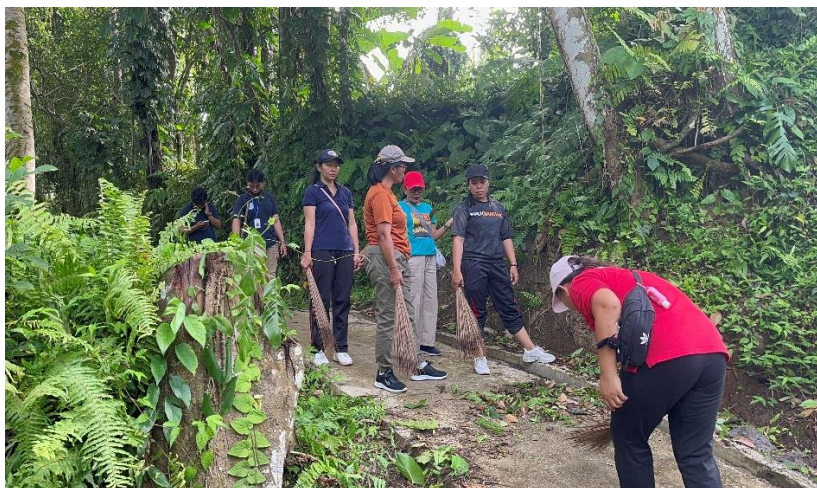
Gambar 5. Gotong Royong di Area Bulakan Magelung

Jalur trekking, cycling dan jogging dipersiapkan sebagai salah satu daya tarik dalam mendukung pengembangan Desa Petak menjadi desa wisata. Namun kebersihan sekitar jalur trekking, cycling dan jogging tidak terjaga dan tidak tertata, untuk itu dalam pelaksanaan KKN juga dilakukan aksi bersih lingkungan di area tersebut pada tanggal 7 Pebruari 2025. Pada kegiatan ini, tim KKN bergotong royong bersama dengan masyarakat dan Pokdarwis. Selain aksi bersih lingkungan juga dilakukan pemilahan sampah organik dan anorganik.