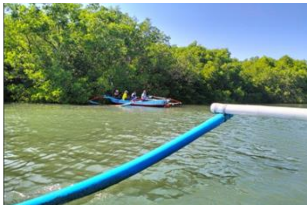
Gambar 1. Suasana dan Aktivitas Kelompok Nelayan Tanjung Sari Dalam Wisata Mangrove di Desa Wisata Kelan

Pemberian pelatihan penyusunan paket wisata mangrove dengan pendekatan regeneratif edutourism kepada Kelompok Nelayan Tanjung Sari selain merupakan upaya untuk mengimplementasikan Pariwisata Regeneratif dalam bentuk edutourism dengan subyeknya adalah nelayan yang tergabung dalam Kelompok Nelayan Tanjung Sari.